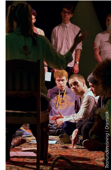
Teorundervisning i Dramatik

Derudover blev der åbnet for intern sparring generelt. Hvis en lærer valgte at lade døren stå på klem, var det en invitation til, at både performere, andre lærere og kursister måtte overvære eller deltage i den undervisning, der foregik i lokalet. Det blev hermed en mulighed især for lærerne til at inspireres og supervisere hinan-