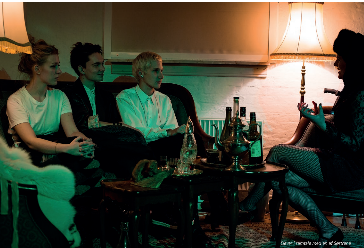
Elever i samtale med en af Søstrene

eksempelvis ondskab, kollektiv intelligens eller universet, og mere eksistentielle spørgsmål som "Hvorfor skal man have talent for at være noget".